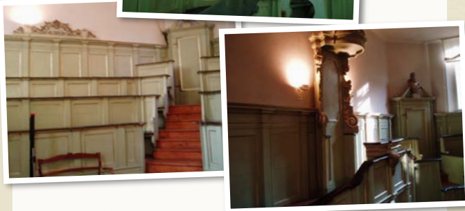
Immagini attuali del teatro Anatomico di Palazzo Paradiso

Nel trasferimento dalla sede originaria delle Crocette di San Domenico al Palazzo Paradiso (1567) si rese necessaria la costruzione di un primo teatro anatomico, dedicato alle dissezioni a scopo didattico frequentate dagli studenti, che contribuirono alle spese per la sua costruzione rinunciando, come risulta dalle cronache, ai soldi destinati alle feste carnevalesche. Fu soltanto nel 1731, grazie all'Anatomico Giacinto Agnelli e all'Architetto Francesco Mazzarelli, che fu approntato il Teatro Anatomico esistente, a pianta ottagonale, con entrate separate per gli studenti, il docente ed il cadavere, illuminato da quattro grandi finestre. Per circa un secolo il teatro Anatomico svolse la sua funzione originaria, fino al 1831 quando la sede della Facoltà di Medicina fu trasportata presso l'Arcispedale S. Anna di Corso della Giovecca.