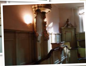
Immagini attuali del teatro Anatomico di Palazzo Paradiso

Nel trasferimento dalla sede originaria delle Crocette di San Domenico al Palazzo Paradiso (1567) si rese necessaria la costruzione di un primo teatro anatomico, dedicato alle dissezioni a scopo didattico frequentate dagli studenti, che contribuirono alle spese per la sua costruzione rinunciando, come risulta dalle cronache, ai soldi destinati alle feste carnevalesche. Fu soltanto nel 1731, grazie all'Anatomico Giacinto Agnelli e all'Architetto Francesco Mazzarelli, che fu approntato il Teatro Anatomico esistente, a pianta ottagonale, con entrate separate per gli studenti, il docente ed il cadavere, illuminato da quattro grandi finestre. Per circa un secolo il teatro Anatomico svolse la sua funzione originaria, fino al 1831 quando la sede della Facoltà di Medicina fu trasportata presso l'Arcispedale S. Anna di Corso della Giovecca.